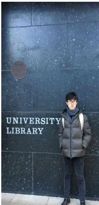
图为作者在爱丁堡大学图书馆门口留影

爱丁堡本身是一座充满魅力的城市。爱丁堡拥有悠久的历史和文化传统，城市里坐落着苏格兰国立博物馆、苏格兰皇家美术馆等诸多名胜古迹。爱丁堡老城区内城堡林立，充满英伦文化底蕴。爱丁堡大学不设立任何围墙，教学机构散布在城市的各个角落，建筑和底蕴与城市本身融