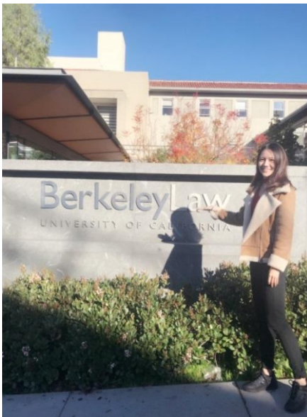
图 1 在伯克利法学院门前留影