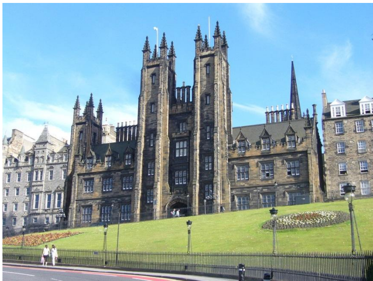
图为爱丁堡大学新学院

在这里学习和生活四年，将是我人生一段重要的经历。我非常感谢政法大学的培养和留学基金委的支持！我会珍惜这段难得的学习经历，早日学成报效祖国！