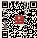
研究生院 微信公众平台