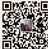
研招办 微信公众平台