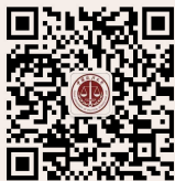
中国政法大学 微信公众平台